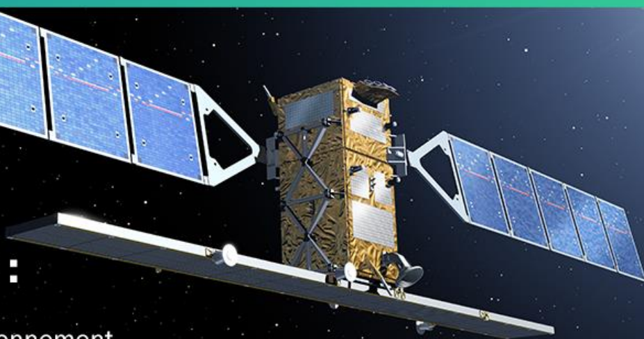
Satellite Sentinel-1, utilisé par la station d'acquisition VIGISAT

Le spatial au service de l'homme et de son environnement le 14 novembre 2019 à IMT Atlantique