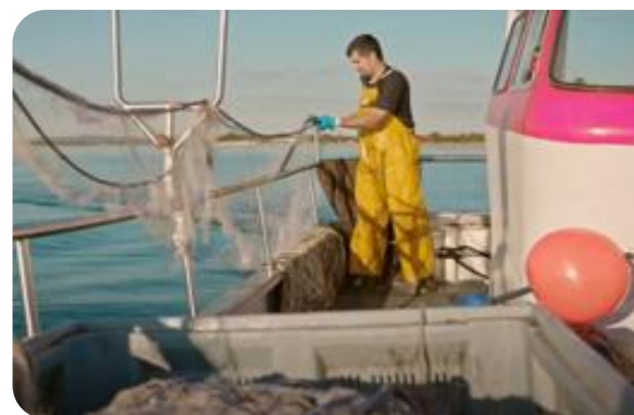
Un pêcheur traditionnel grec remonte son filet lors d'une sortie en mer

L'Europe n'a pas encore imposé de réglementation quant au suivi des bateaux de pêches côtiers, que l'on dénombre pourtant en centaine de milliers, mais elle y réfléchit sérieusement. Au travers du projet STARFISH, l'Europe a confié à CLS la mission de déployer un système de localisation par satellite pour les pêcheries traditionnelles grecques et mauritaniennes. La Grèce, car elle possède le plus grand nombre de navires artisanaux en Europe, et la Mauritanie car c'est l'un des principaux exportateurs de produits de la pêche vers l'Europe.