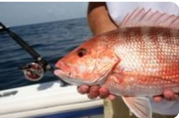
Une belle prise dans le Golfe du Mexique. Un pêcheur tient un magnifique vivaneau rouge.