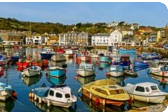
Port de pêche en Angleterre

La Grande Bretagne, pionnière, a décidé en Octobre 2021, au travers du MMO (Marine Management Organisation), de rendre obligatoire le suivi des flottes de pêche côtières.